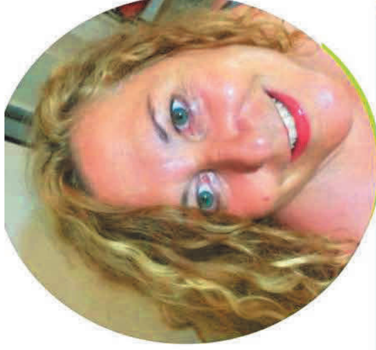
EMILIA MEZZATESTA SCUOLA PRIMARIA

Ho accettato di candidarmi in questa lista perché credo nelle cose umili, ho sempre lottato per il riscatto sociale e la dignità della persona, promuovendone la crescita personale e sociale. Conosco il mondo della scuola paritaria, della scuola pubblica e della cooperazione sociale. Ogni giorno della mia vita dal 1990 l'ho vissuto educando, empatizzando con alunni, colleghi, famiglie, associazioni. Ritengo che la nostra presenza nel mondo del sindacato dei "Grandi" possa fare la differenza. Se sei sfiduciato/a e non ti senti ascoltato/a sappi che tanti docenti sono nella tua stessa condizione. Fai un passo di fiducia, aiutaci a riappropriarci della dignità del ruolo, ormai perso nel tempo.