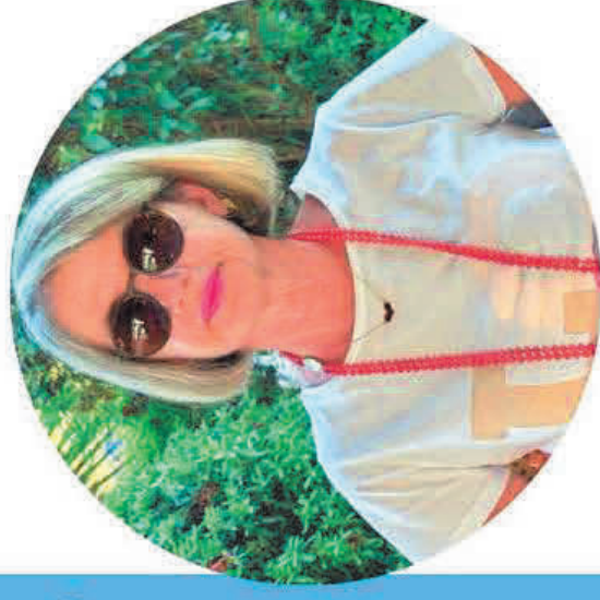
Michela Acconci Scuola Primaria

Ecco il perché della mia candidatura e la scelta di questo Sindacato che ha fatto proprie le lotte per una SCUOLA DEMOCRATICA, LIBERA che sappia dare dignità' alla professione degli insegnanti e che passi anche da una " giusta" riqualificazione economica.