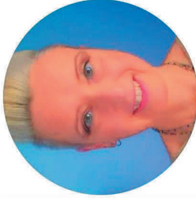
MARTA ERODIANI SCUOLA PRIMARIA

Sono fermamente convinta che la scuola sia un luogo di crescita fondamentale per gli studenti e che il benessere di tutti i componenti della comunità scolastica sia un prerequisito per il successo formativo. Per questo, se eletta al CSPI, mi impegnerò con tenacia e passione a rappresentare gli interessi di tutti, lavorando per un sistema scolastico sempre più inclusivo, equo ed efficiente."